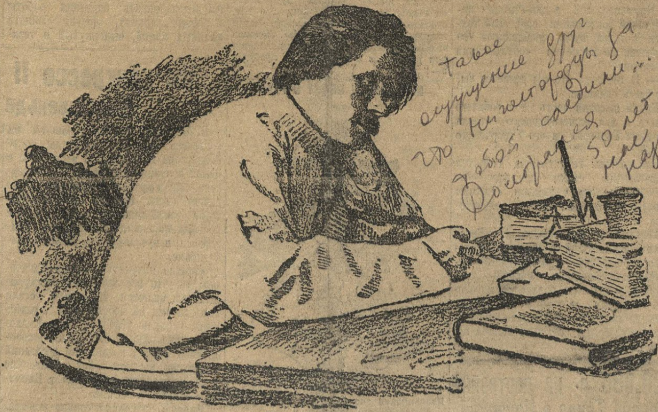
Максим Горький в своем рабочем кабинете в Н.Новгороде в 1901 году.

Речь на торжественном заседании объединенного Горсовета 7-го августа.